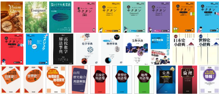
📖: ネイティブ音声などの音声収録